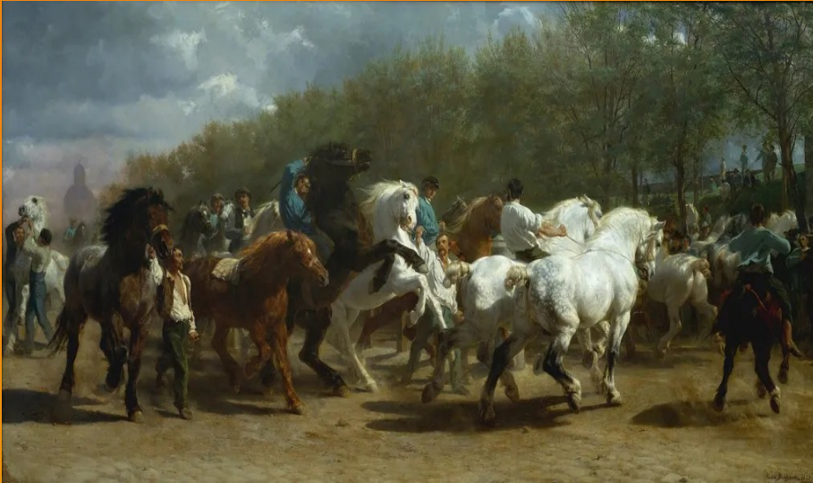
Le marché aux chevaux, huile sur toile de la peintre française Rosa Bonheur, de 1852 à 1855.