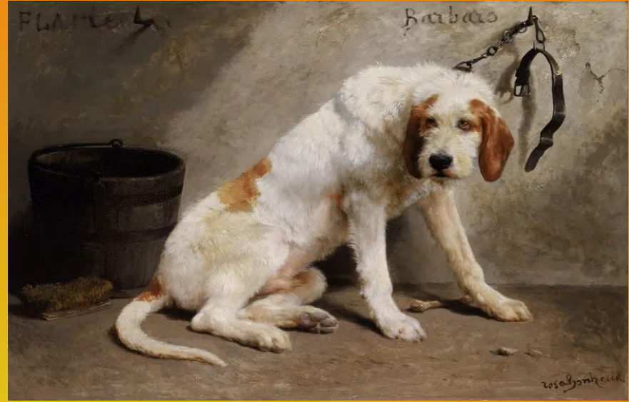
Barbaro après la chasse, 1851, huile sur toile