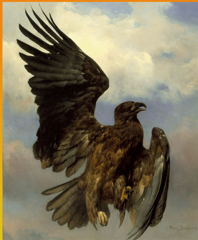
L'aigle blessé, 1870, huile sur toile