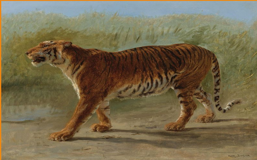
La marche du tigre royal, huile sur toile, non daté