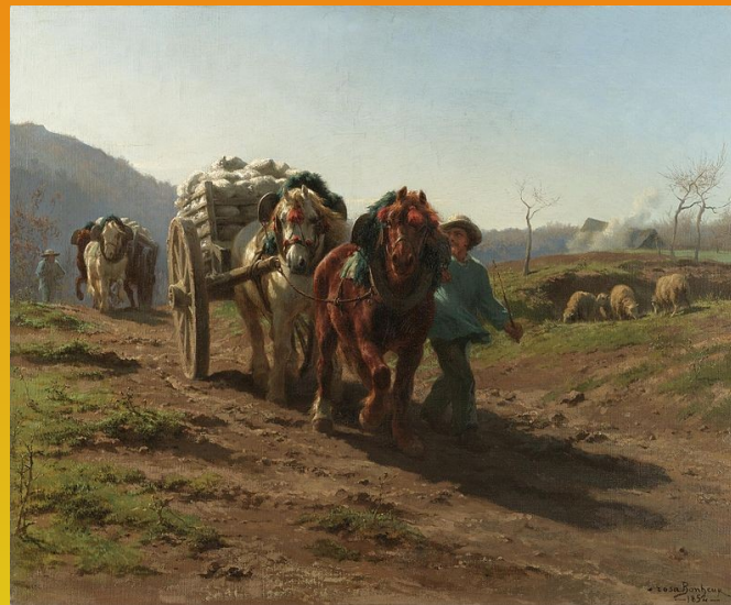
Retour des champs, 1854, huile sur toile