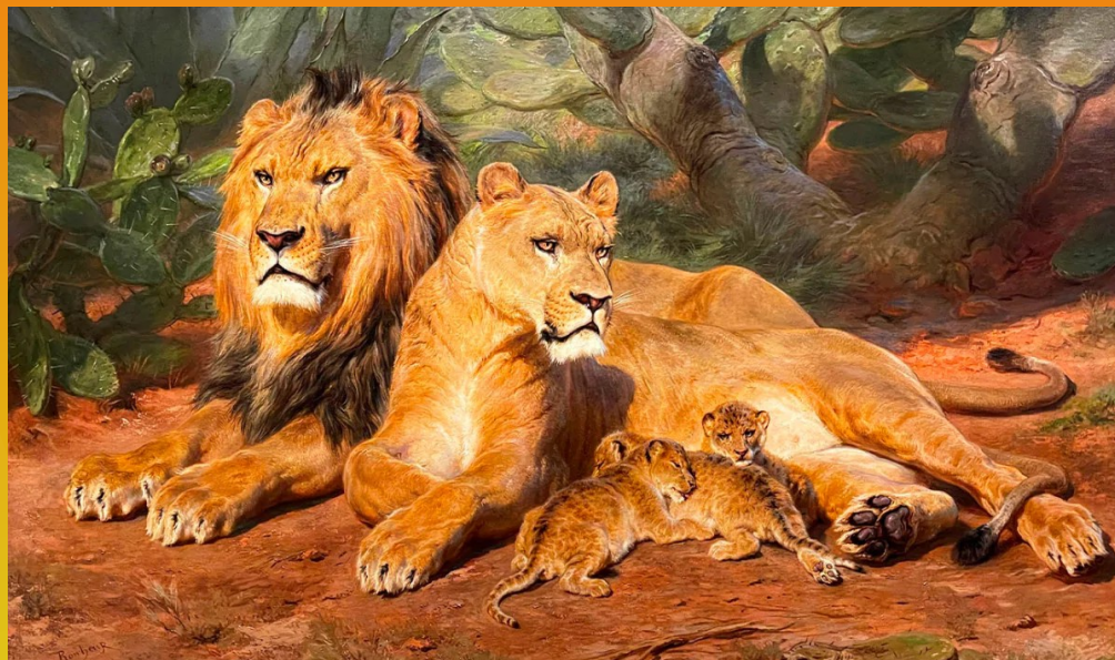
Le lion chez lui, 1881, huile sur toile