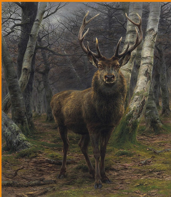
Le roi de la foret, 1878, huile sur toile