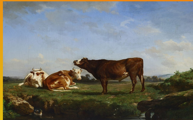
Trois vaches au pâturage, 1854-1850, huile sur toile