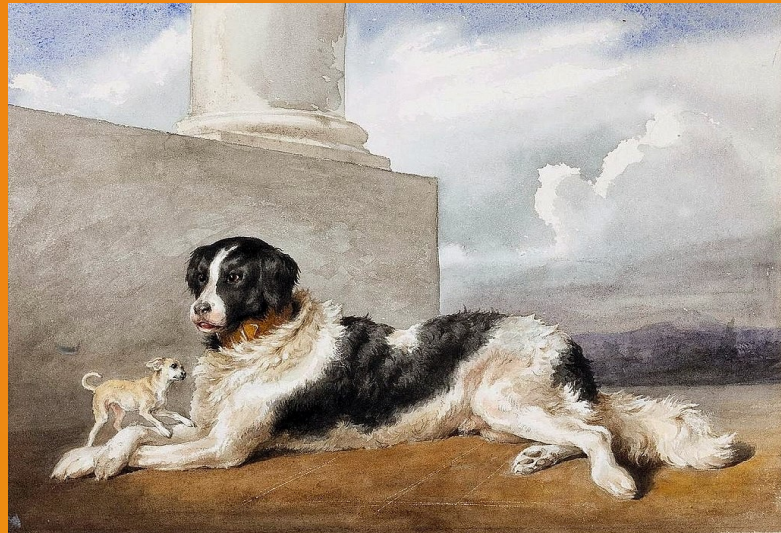
Aquarelle sur papier, vers 1850, Sultan et Rosette, chiens des princes