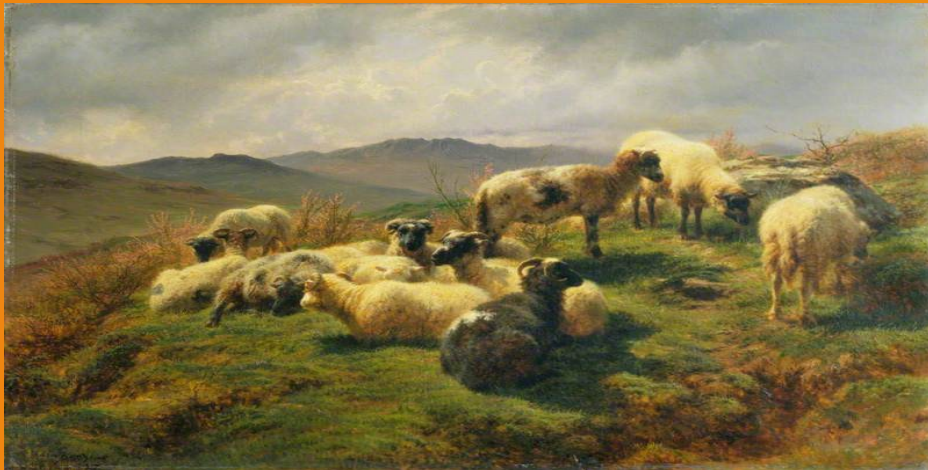
Moutons dans les Highlands, 1857, huile sur toile