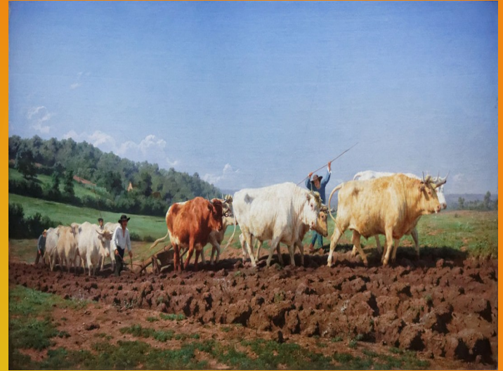
Labourage nivernais, 1848, huile sur toile