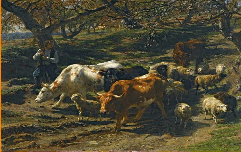
Berger avec son troupeau, 1851, huile sur toile